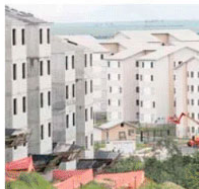
IMÓVEIS POPULARES: margem

NESSO CASO, a prestação do financiamento seria de R$ 792, sem inserir o aporte do FGTS. Com o valor do FGTS financiando uma parte desse imóvel, a prestação cairia para R$ 660, ou seja, o Fundo de Garantia iria