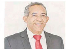
VAZ: otimista com queda dos juros

"O FGTS é fundamental para a habitação e o saneamento. Estamos otimistas com a redução dos juros e o setor tem respondido com aumento na produção".