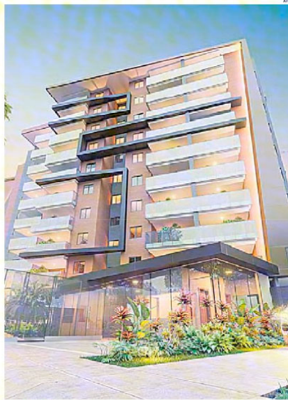
PROJEÇÃO do Argo Camburi, novo lançamento para a capital capixaba