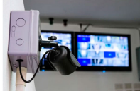
Inteligência artificial aplicada aos condomínios, como a automação e a inteligência artificial, que já foram usados em condomínios em outros países.

Investimento em tecnologia traz benefícios de aplicação de inteligência artificial e inteligência artificial para facilitar e garantir aos moradores.