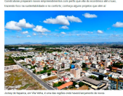
Projeto de um novo empreendimento imobiliário em Vitória, ES.

Com o ano chegando ao fim, é hora de refletir sobre as tendências do mercado imobiliário para 2023. Segundo especialistas, o setor deve continuar em crescimento, impulsionado por fatores como a recuperação econômica e a busca por imóveis mais modernos e sustentáveis. As principais tendências apontadas são: • Imóveis sustentáveis: Há uma crescente demanda por construções que utilizem materiais ecológicos e tenham certificações ambientais. • Smart Homes: A incorporação de tecnologia em residências, como automação de iluminação e segurança, tornou-se uma tendência. • Flexibilidade: Imóveis com espaços adaptáveis para diferentes usos, como escritórios em casa, são mais procurados.