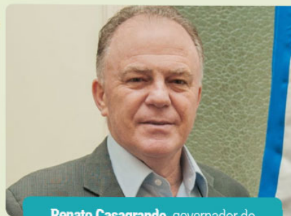
Renato Casagrande , governador do Estado do Espírito Santo

"Parabéns à Revista ES Brasil pelas 200 edições informando os capixabas. Uma revista moderna, que traz em seu conteúdo o melhor da economia capixaba e do Brasil. Com o aumento do interesse da população em temas econômicos, a revista ES Brasil se tornou referência. O Espírito Santo, com sua economia crescendo mais do que a brasileira, conta com veículos que possam informar a população sobre os avanços na área econômica e a revista ES Brasil vem desempenhando com excelência este papel."