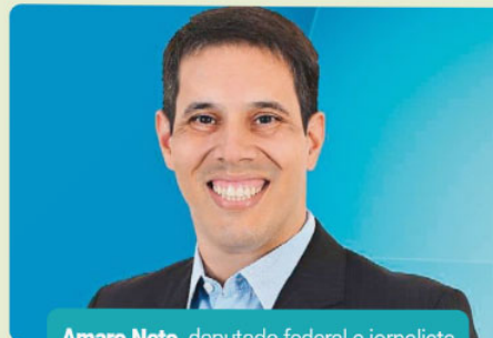
Amaro Neto , deputado federal e jornalista

"Parabéns à ES Brasil pelo profissionalismo e competência nessas 200 edições cobrindo o cenário econômico do Espírito Santo. Uma história de sucesso no jornalismo e de grande contribuição aos leitores capixabas. Que venham muitas outras edições, com informação de qualidade como a ES Brasil se especializou em fazer."