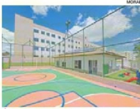
ÁREA de lazer do Vista do Bosque