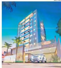
FACHADA do Vogue Enseada