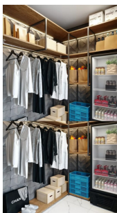
Entre as comodidades do New Jersey Residence está a conveniência service disponível no empreendimento

"Ainda há muitos terrenos e alguns próximos da praia, que é a localização mais procurada. Com a chegada de novos empreendimentos e moradores, surgem novas pontos comerciais que contribuem ainda mais para a valorização", explica Gonçalves.