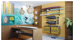
Beach Point também é um espaço diferenciado do New Jersey Residence

O New Jersey Residence será localizado na Avenida Saturnino Rangel Mauro, na Praia de Itaparica, em Vila Velha. As unidades contam com apartamento de 3 quartos, sendo uma suíte, entre 75,20 m² e 83,37 m². O empreendimento também inclui pool, lounge café e outros espaços funcionais.