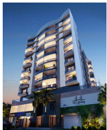
O nome do edifício New Jersey foi escolhido pelo próprio presidente do Grupo, Lamberto Palombini Neto

"A captação de água da chuva e do ar-condicionado com o ponto de reaproveitamento de água contribuem para a redução do consumo do recurso hídrico pelo condomínio. Sensores de presença e as lâmpadas de led nas áreas comuns também são fatores essenciais para a redução da energia consumida pelo prédio, podendo reduzir as contas no final do mês", explica Gonçalves.