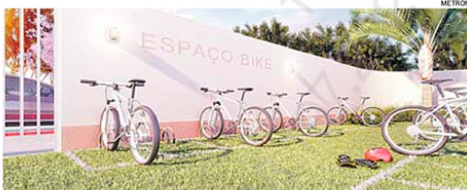
O VIA MAR, lançamento da Metron Engenharia, terá “espaço bike”

Morada de Laranjeiras tem o Hospital Jayme dos Santos Neves, por exemplo, que é uma grande referência. Com a chegada de novos serviços e novos moradores dispostos a consumir, mais estabelecimentos são atraídos para o local. É uma reação em cadeia”.