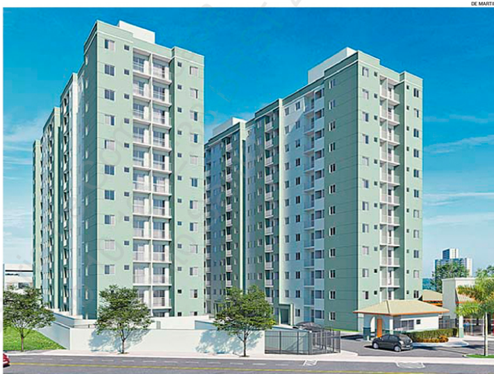
SITUADO em Jardim Limoeiro, o Villa do Mestre Residencial Clube terá 288 unidades distribuídas em duas torres

O Vila de Itapuá tem apartamentos de dois quartos, com unidades adaptadas para PCD. A área de lazer terá salão de festas e playground. O preço é a partir de R$ 167.978,00.