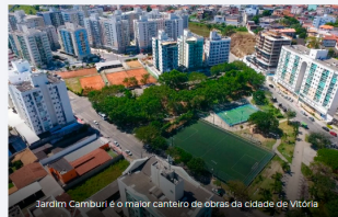
Jardim Camburi é o maior canteiro de obras da cidade de Vitória

Em termos de moradia, o bairro abriga opções de apartamentos que vão desde imóveis compactos, como os studios (de um quarto) a unidades de quatro dormitórios, além, é claro, de também contar com a oferta de lojas e salas comerciais. Não foi à toa que a Argo Construtora, com 17 anos de mercado, resolveu apostar em Jardim Camburi ao chegar em Vitória. A empresa é dominante no mercado de Vila Velha e investiu no bairro mais populoso de Vitória com o empreendimento Residencial Argo Camburi. Com 2 quartos com suíte, em tamanho diferenciado e alto padrão de acabamento, o prédio se destaca pela boa localização. São quase 2 mil m 2 projetados com 40 itens de lazer.