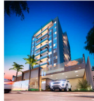
Prédio em Vitória, na Praia de Santa Helena.

Apartamentos menores e acanhados, situados perto do comércio e com áreas de lazer diferenciadas são bastante procurados por jovens casais e solteiros. Atualmente, a modernidade das plantas e a versatilidade dos ambientes compactos atraem os investidores. Neste período de pandemia e de crise financeira a garantia de segurança e de alta liquidez do imóvel podem ser fatores decisivos no processo de compra.