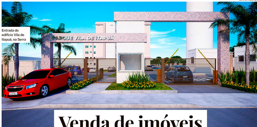
Entrada do edifício Vila de Itapuá, na Serra